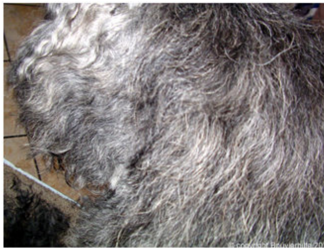
1.Bild: Backenbart ungeschnitten von hinten gesehen