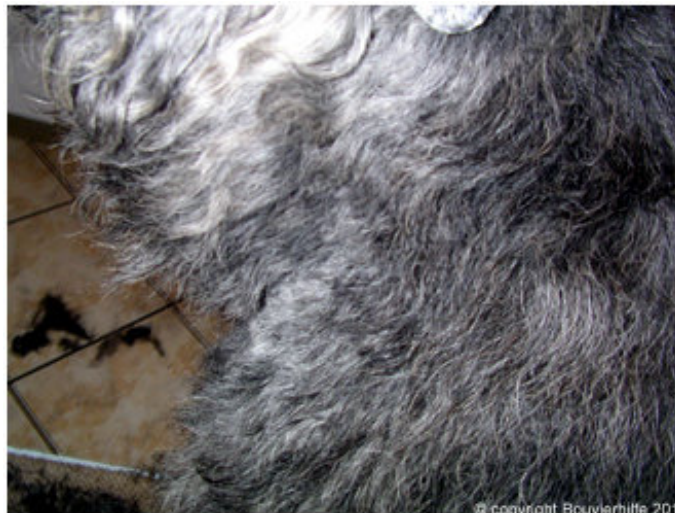
2.Bild: Hals ist von vorn bereits vom Brustbein bis zum Kehlkopf freigeschnitten